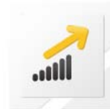
Optymalizacja wydajności serwisów www