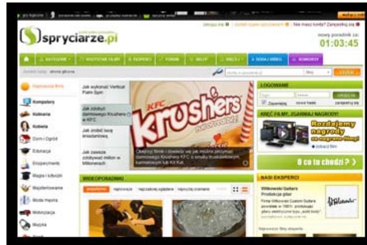
Widok strony głównej serwisu www.spryciarze.pl

Problemy w działaniu serwerów rozwiązywane są 24 godziny na dobę, we wszystkie dni w roku, dzięki czemu praca serwisu jest nieprzerwana i dostępna dla użytkowników i odwiedzających portal www.spryciarze.pl .